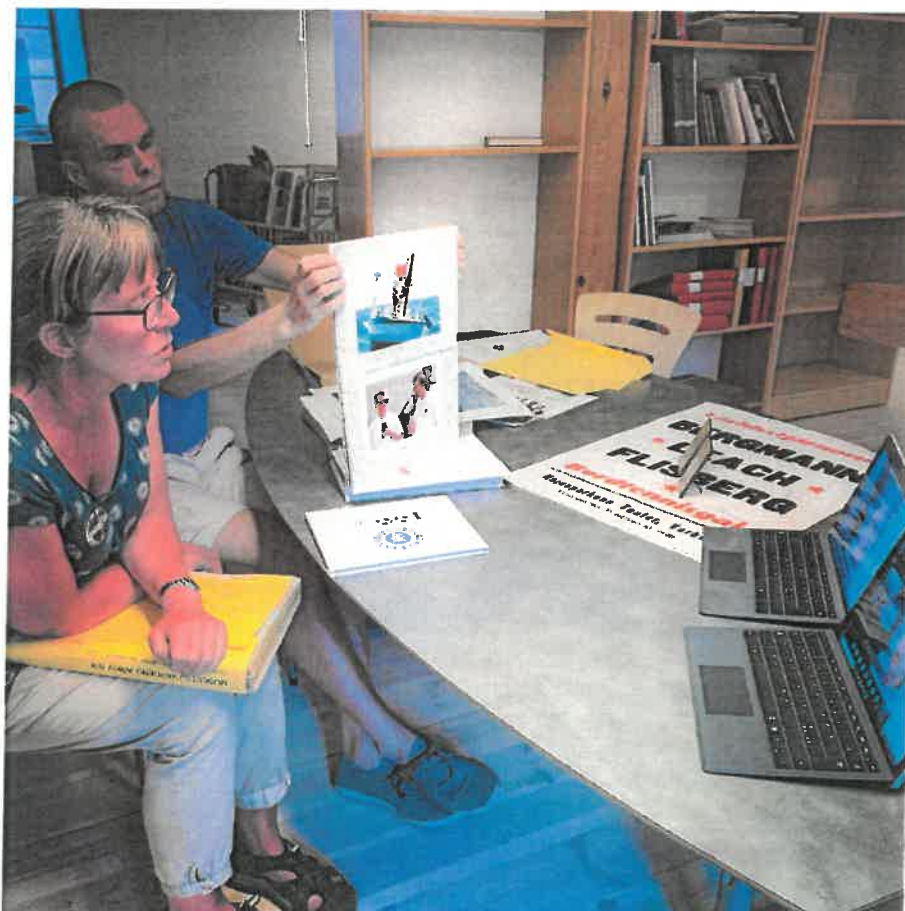
Digital utbildning i arkivet i samarbete med Sisu idrottsutbildarna, våren 2020